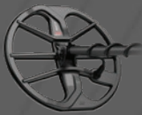
Bobina EQX11™ con placa de deslizamiento Doble D redonda de 11" – Sumergible a 5 m [16 pies]