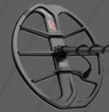
Bobina EQX15™ con placa de deslizamiento doble D elíptica de 15"x12" – Sumergible a 5 m [16 pies]